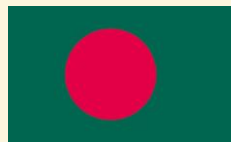
バングラデシュ গণপ্রজাতন্ত্রী বাংলাদেশ