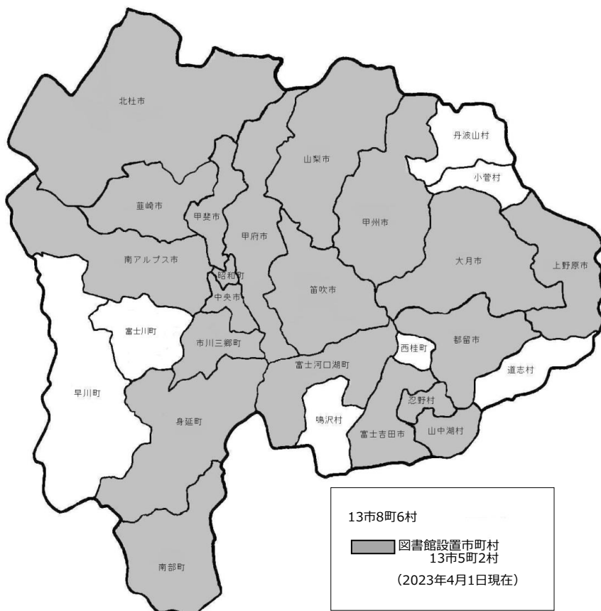
図1 県内図書館設置市町村