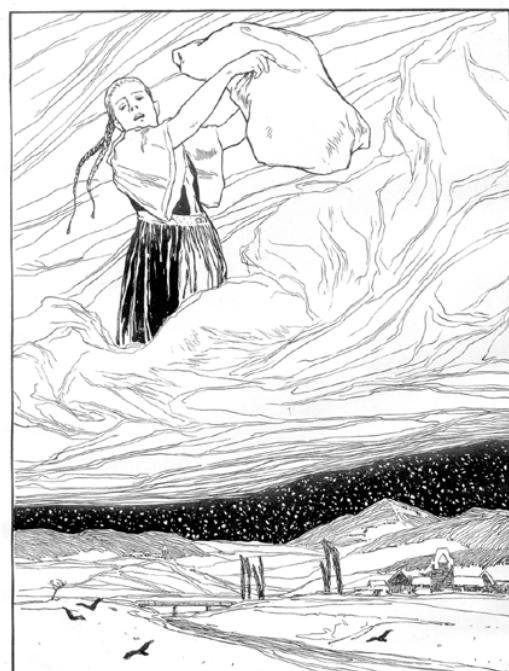
オットー・ウベローデ／画「ホレ婆さん」