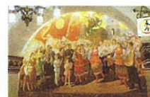
地下鉄キエフスカヤ駅