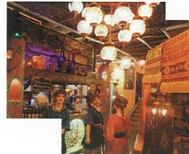
エンタメレストラン