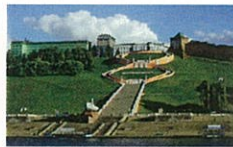
ヴォルガ川から チカロフの階段へ