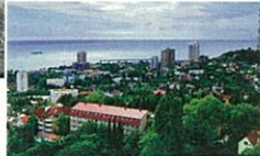
黒海に臨む保養地ソチ