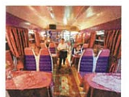
シベリア鉄道オケアン号