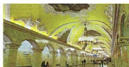
地下鉄コムソモーリスカヤ駅