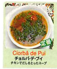
定番 Ciorbă de Pui チヨルバデプイ チキンでだしをとったスープ