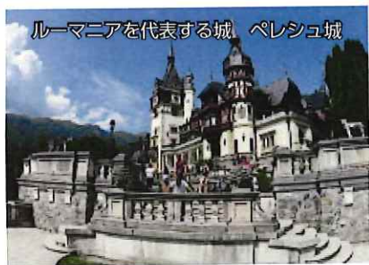
ルーマニアを代表する城、ペレシュ城