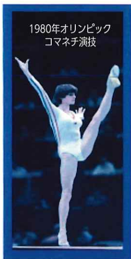
1980年オリンピック コマネチ演技