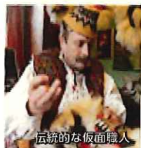
伝統的な仮面職人