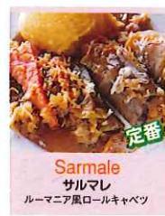
定番 Sarmale サルマレ ルーマニア風ロールキャベツ