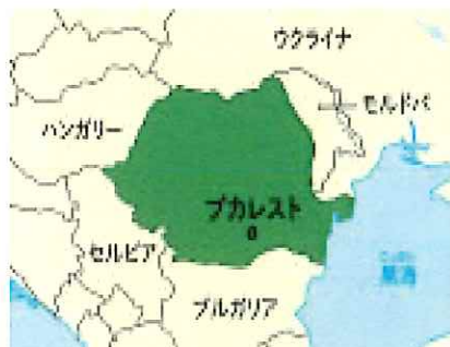
ルーマニア (首都ブカレスト)

ABCDEFGHIJKLMNOPQRSTUVWXYZabcdefghijklmnopqrstuvwxyzABCDEFGHIJKLMNOPQRSTUVWXYZ