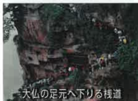
天仏の足元へ下りる棧道