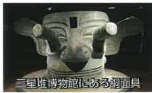
三星堆博物館にある銅面具