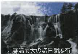
九寨溝最大の諾日朗瀑布