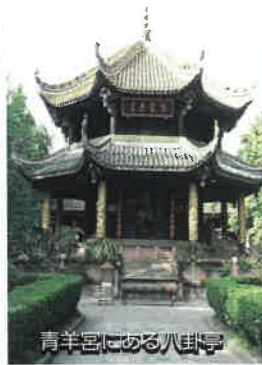
青羊宮にある八卦亭