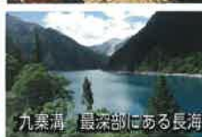
九寨溝 最深部にある長海