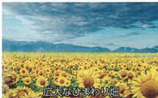
広大なひまわり畑