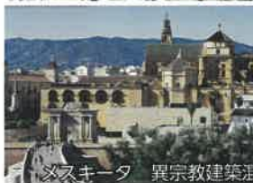
ミスキータ 異宗教建築混在