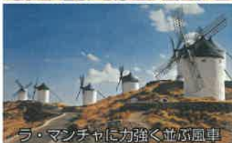
ラ・マンチャに力強く並ぶ風車