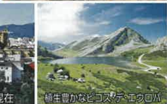
植生豊かなニコスデ・エウロハ