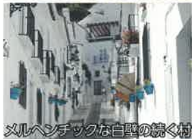
メルヘンチックな白壁の続く村