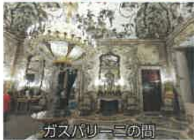
ガスパリーニの間