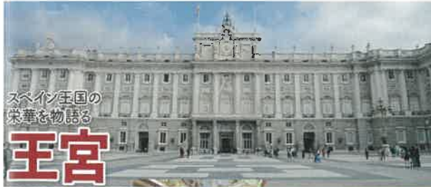
スペイン王国の 栄華を物語る 王宮

ABCDEFGHIJKLMNOPQRSTUVWXYZ ABCDEFGHIJKLMNOPQRSTUVWXYZ ABCDEFGHIJKLMNOPQRSTUVWXYZ ABCDEFGHIJKLMNOPQRSTUVWXYZ