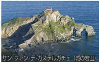
サン・ファン・デ・ガステルガチェ (城の岩山)