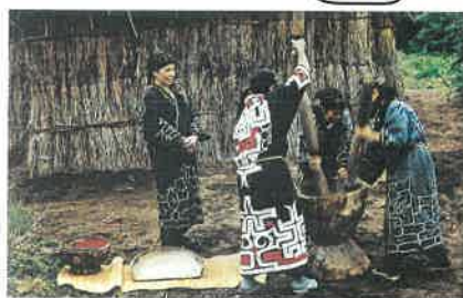
神様への供物づくり