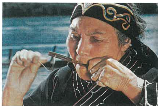
アイヌが好む〈ムックリ〉と呼ばれる竹製の口笛