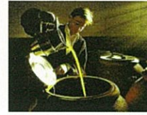
オリーブオイルづくり