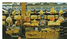
いろいろなチーズ