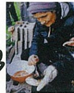
ウニの下ごしらえ