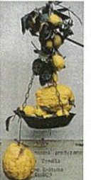
チェドロ皮を食べる