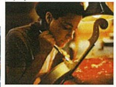
バイオリンをつくる