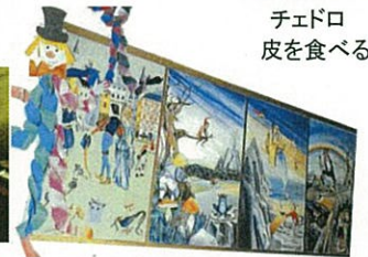
学校の廊下に飾ってある絵