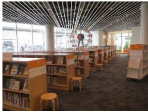
▲えほん かんらんしゃ 絵本の観覧車

○子どもの本が置いてある 児童資料コーナー には、 赤ちゃん から、 幼児 、 小学生 、 中学生 向けの 本 があります。