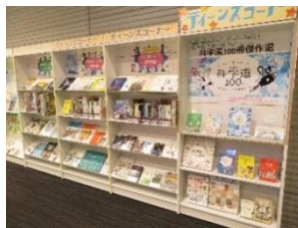
▲ティーンズコーナー

○ ティーンズコーナー は、 中学生・高校生 を対象とした 資料展示コーナー です。 学校生活 や 進路 に関する 本 などを、 年4回 、 テーマ別 に 展示 します。