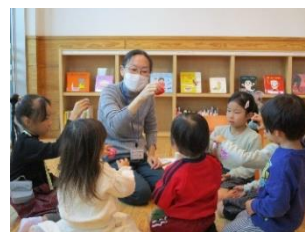
▲お手玉を使ったわらべうたで遊ぶ様子