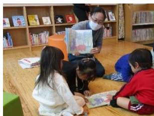
▲点字や絵の輪郭を手で触り確かめている様子