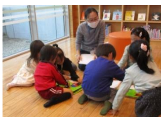
▲おむすびやおじいさんのパーツを動かす様子