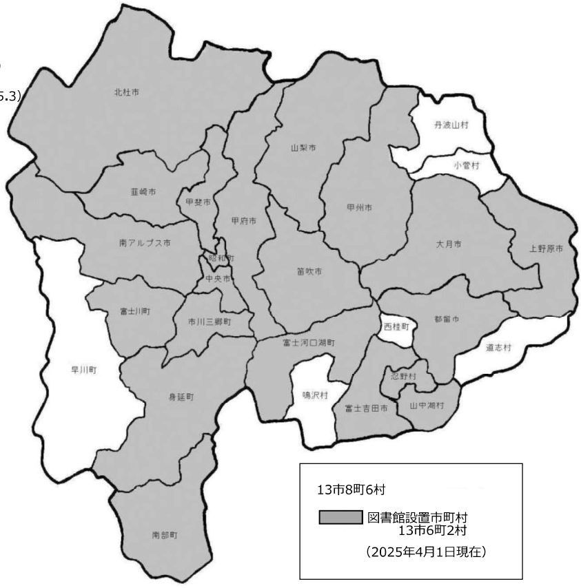
図1 県内図書館設置市町村