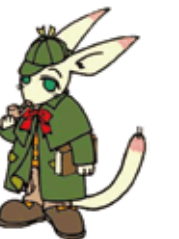
イメージキャラクター ジッポ・ホンムズ・一世

※入場料金を徴収する場合はこの表の料金に2割の割増率を乗じた額を加算した額とします。 ※備品、予約方法等は総合案内または下記までお問い合わせください。 (施設予約専用電話) 055-255-1041