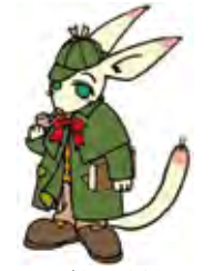
イメージキャラクター ジッポ・ホンムズ・一世

※入場料金を徴収する場合はこの表の料金に2割の割増率を乗じた額を加算した額とします。 ※備品、予約方法等は総合案内または下記までお問い合わせください。 (施設予約専用電話) 055-255-1041