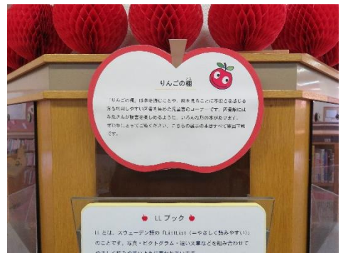
〈「りんごの棚」や資料の説明〉

図書館に入ってすぐの展示スペースに「りんごの棚」はあります。スウェーデンで生まれた「りんごの棚」の取り組みをたくさんの方に知っていただきたいと思い、図書館を利用される方の目に留まりやすいこの場所に設置することにしました。資料の背表紙にはりんごのマークのシールが貼ってあります。「りんごの棚」や、展示している資料についての簡単な説明も掲示しました。より詳しく知りたい方は、職員にお声かけください。