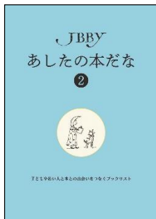
〈「あしたの本だな」 ①・②冊子版〉

対象 10代の子どもたちを中心対象としていますが、どの年齢でも参考にいただけます。少年院、少年鑑別所以外でも、生きづらさを抱えた子ども、本に苦手意識を持っている子ども、本に触れる機会が少なかった子どもたちにおすすめの本を集めました。