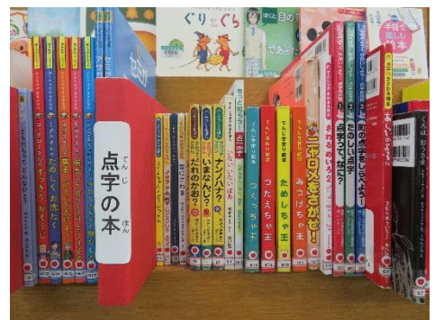
〈「りんごの棚」に並ぶ点字の本〉

※「りんごの棚」の設置にあたっては「りんごプロジェクト」(NPO法人ピープルデザイン研究所主催)及び、「公益財団法人 日本障害者リハビリテーション協会 情報センター」に問合せをしました。