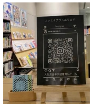
〈QRコードが印刷されたポスターやカード〉

アカウント開設の際は、QRコードが印刷されたカードを作り、YAコーナーや各階のチラシ置き場などに設置しました。QRコードを中心に配置したプレゼントボックスのデザインで、クラフト紙や色厚紙を使用し、持ち帰りたくなるように工夫しました。図書館職員や学校図書館司書向けの研修時や、中高生が図書館見学に来館した際に配布しました。