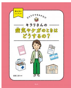
『キラリさんの 病気やケガのときはどうするの?』 読書工房/編・著 国土社 2022年

やさしい言葉でわかりやすく書か れた本です。短くてやさしい文章 と、絵、写真、ピクトグラム (絵 記号) を組み合わせて作られ、漢字 にはふりがな (ルビ) がふってあり ます。