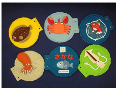
『さかな』 ふきのとう文庫制作

布でできた絵本です。絵や文字が アップリケなどで作られ、さわって 物の形を確かめることができます。 スナップ、マジックテープ、ファス ナーなどで、くっつけたり、はずし たり、ボタンをはめたり、いろいろ なしかけがついています。