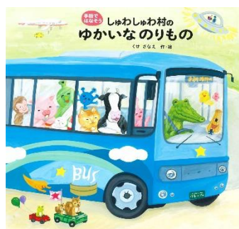
『しゅわしゅわ村のゆかいなのりもの』 くせさなえ/作・絵 偕成社 2018年