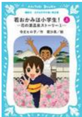
おお もじ あお とり ぶん こ 大きな文字の青い鳥文庫 『若おかみは小学生！ 一花の湯温泉ストーリー 1—上』 令丈ヒロ子/作 亜沙美/絵 講談社 2009年

おお か ほん も 大きな文字で書かれた本です。文 じ おお つうじょう もじ ばいじょう 字を大きく（通常の文字の倍以上 かくだい しょうたい み に）拡大し、書体（フォント）を見 えやすいものに変えて印刷されてい か いんさつ ます。