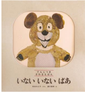
『てんじつきさわるえほん いないいないばあ』 松谷みよ子/ぶん 瀬川康男/え 童心社 2021年

てんじ ゆび よ もじ 点字（指でさわって読む文字）つ えほん え りんかく もよう きの絵本です。絵も輪郭や模様など も あ いんさつ を盛り上げて印刷し、さわってわか くふう るように、工夫されています。 め み ひと み ひと いっしょ 目が見える人も見えない人も一緒 たの に楽しむことができます。