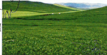
エ夏は が咲く 草原