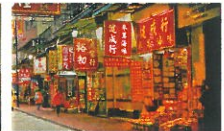
乾物や漢方のおいが漂う