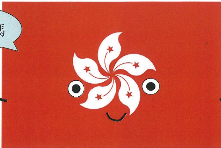
中国香港特別行政区旗