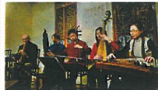
サロンコンサート