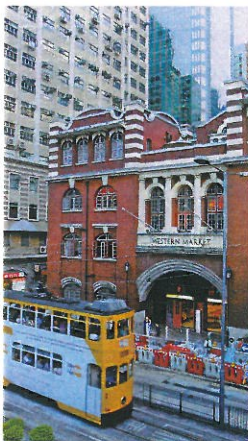
◀ウェスタンマーケットとトラム