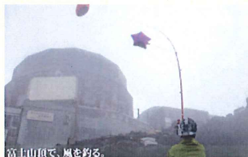
富士山頂で、風を釣る。

立教新座中学校・高等学校教諭。富士山頂に滞在してそこで起こる自然現象を理科の実験にいかせないかなどを研究する。気圧、日照、放射線など教育現場への活用を想定した実験のアイデアなどを日々考えている。